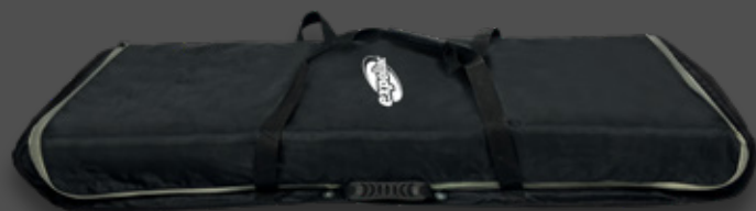
Sac souple à roulettes en option.