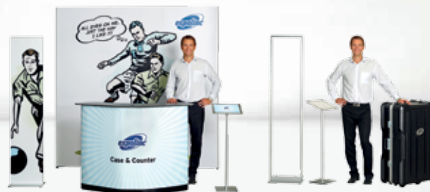
Combinaison #16 Flat Base & Magnet Frame + Pop Up Magnetic + Case & Counter + Info Stand