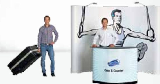
Combinaison #13 Pop Up Magnetic + Case & Counter