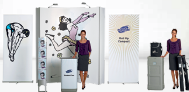
Combinaison #14 Pop Up Magnetic + Brochure Stand + Standard Case + Roll Up Compact